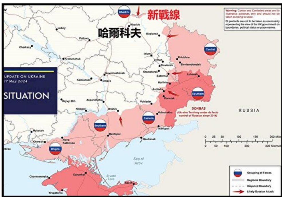
圖一：俄軍 2024 年夏季攻勢新戰線