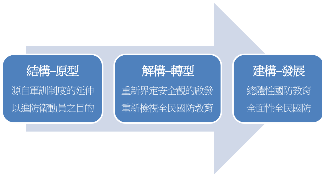
圖 1：本文研究架構圖