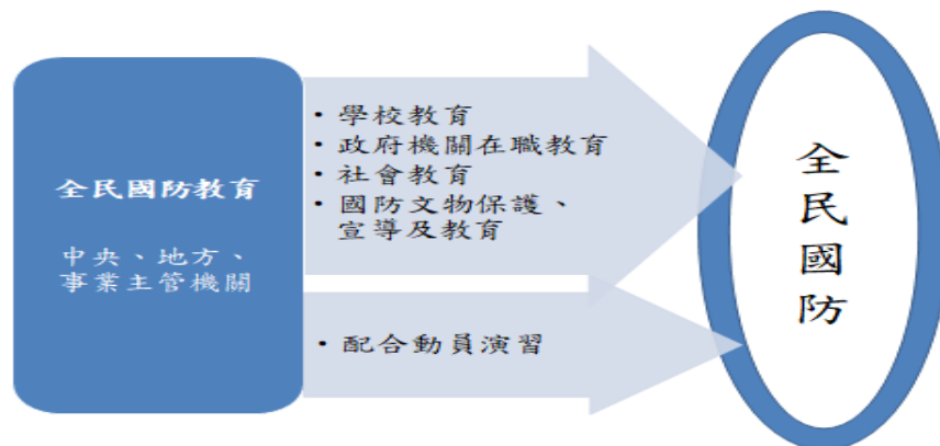
圖 3 我國全民國防教育理論架構

國民中、小學全民國防教育之融入式教學，並向上延續大專校院全民國防教育課程之實施，來達到各級學校共同推動全民國防教育之目的（如圖 4）。 26