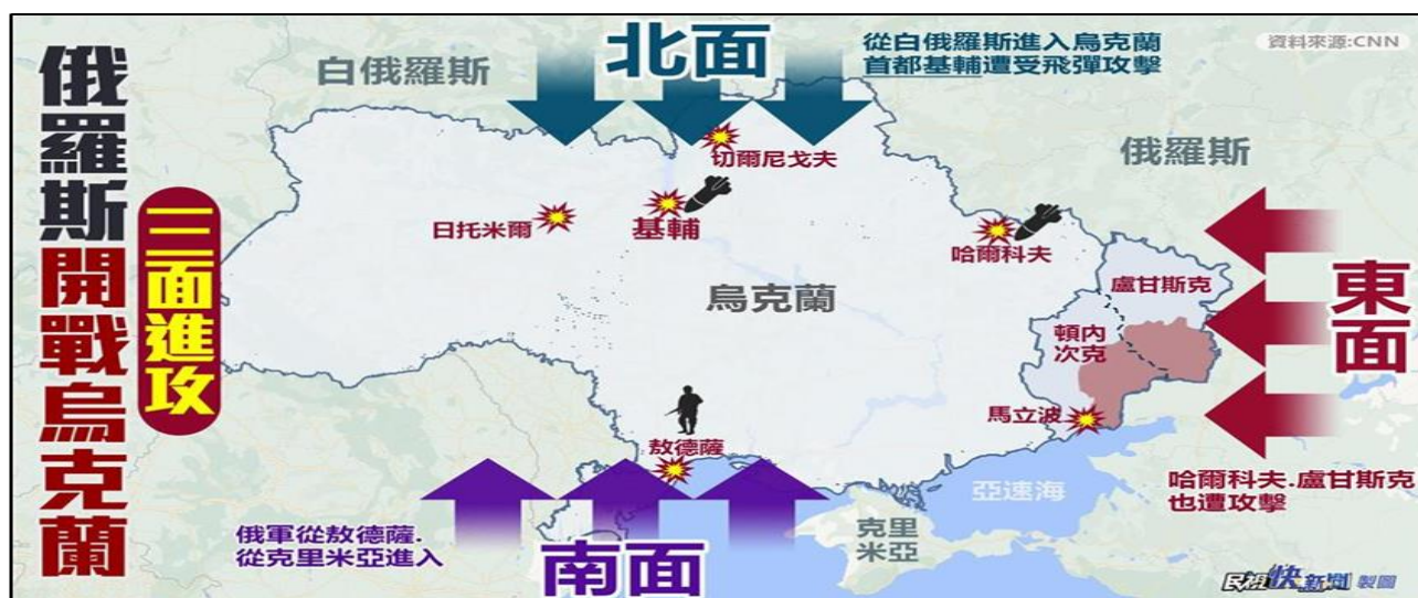
圖 1 俄羅斯侵入烏克蘭攻勢規模

參考資料:〈俄羅斯入侵烏克蘭「三面夾擊」〉,民視新聞網,2022年2月24日, https://bit.ly/3ekrgJG ,檢索日期:2022年9月10日。