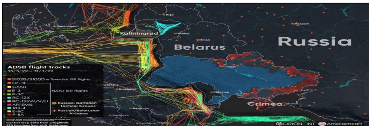
圖 4 北約電偵機對俄羅斯心理作戰軌跡圖

國政府和軍方網路進行 DDoS 襲擊，透過即時大量發送流量，瞬間攻擊網路，使得許多企業、銀行網站，經常無法使用。 25