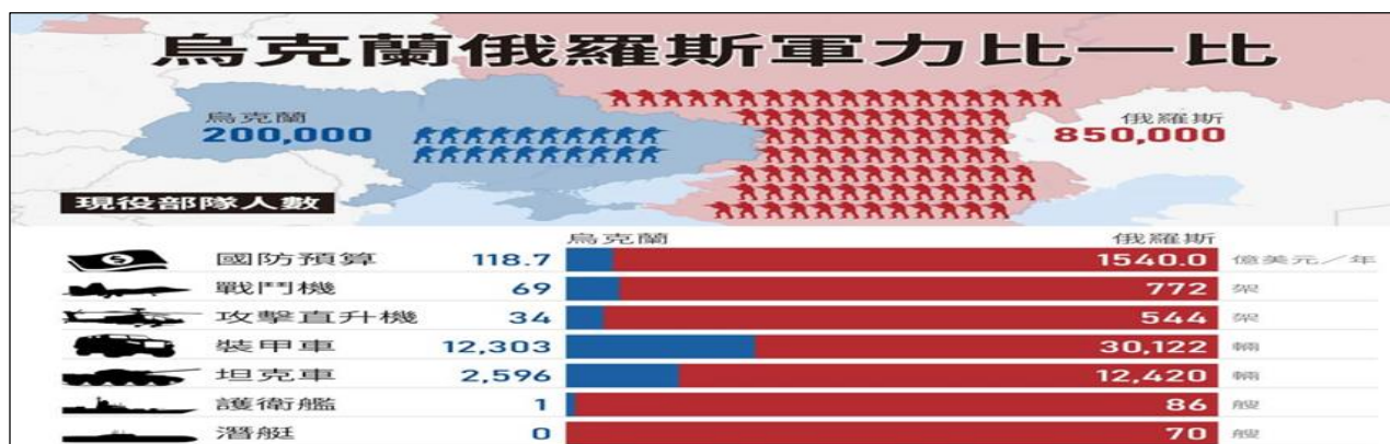
圖 3 俄羅斯、烏克蘭軍事力量比

資料來源：〈烏克蘭軍力遠不如俄國 專家：仍能強力反抗入侵〉，中央社，2022 年 2 月 24 日， https://www.cna.com.tw/news/aopl/202202240327.aspx ，檢索日期：2022 年 9 月 6 日。