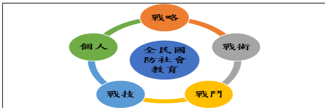
圖 6 全民國防社會教育策進方案